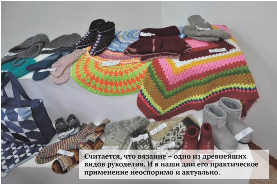
Считается, что вязание – одно из древнейших видов рукоделия. И в наши дни его практическое применение неоспоримо и актуально.

Завершила работу очередная выставка декоративно-прикладного творчества «Мастеровые», в которой приняли активное участие работники предприятия.