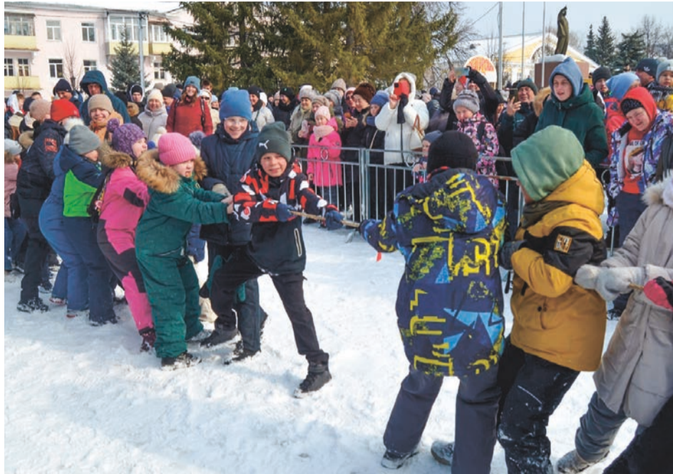
Еще издревле для забавы «Перетягивание каната» заранее вязали длинный канат из нескольких веревок. В перетягивании принимали участие две команды по 15-20 человек. Чем больше народа тянет канат, тем конкурс зрелищней.

Кульминацией яркого, веселого и забавного представления стало традиционное сожжение чучела Зимы.