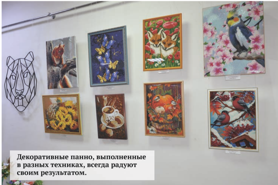
Декоративные панно, выполненные в разных техниках, всегда радуют своим результатом.