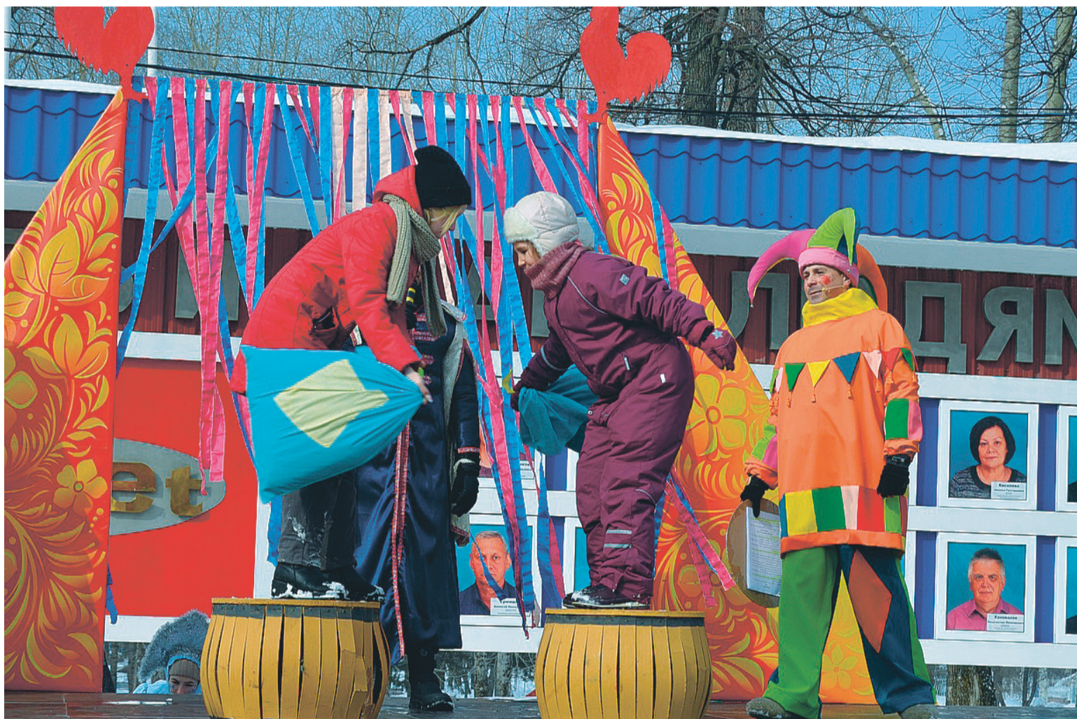
На Руси бой мешками – традиционное развлечение масленичных гуляний. В Аше ни одни провода зимы не обходятся без этой веселой забавы.

10 марта на центральной площади Аши царило оживление – практически все горожане выбрались в ясный и по-весеннему теплый денек на провода зимы.