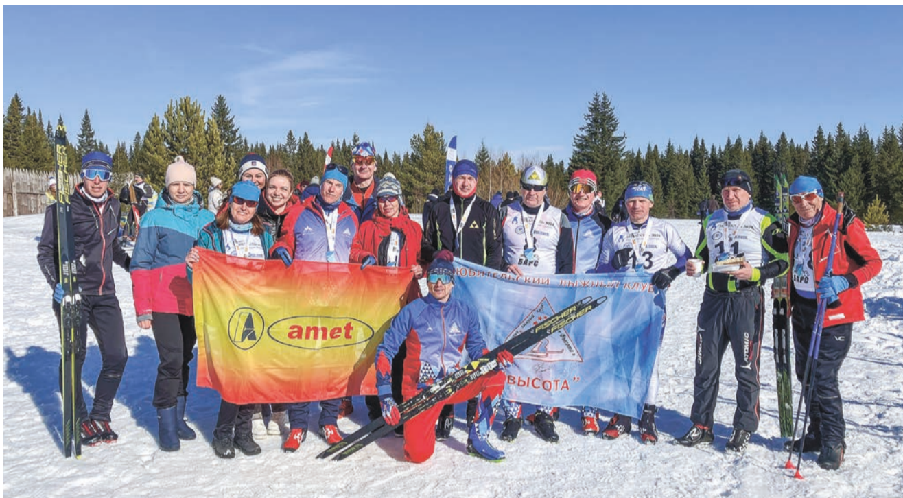
18 спортсменов ЛЛК «Высота», среди которых семеро заводчан, проверили свои силы и выдержку в лыжном марафоне «ЗЮРАТКУЛЬ-2024»

23 марта в национальном парке Зюраткуль состоялся лыжный марафон «ЗЮРАТКУЛЬ-2024», в котором приняла участие внушительная команда любительского лыжного клуба «Высота» в составе 18 человек, в том числе сотрудники ПАО «Ашинский метзавод».