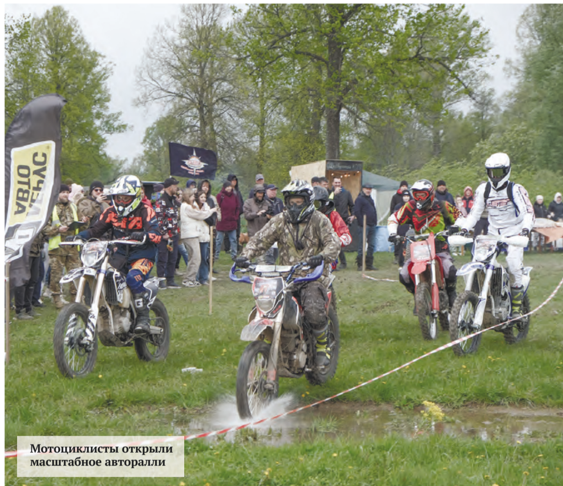
Мотоциклисты открыли масштабное авторалли

11 мая в Аше прошел одиннадцатый ежегодный фестиваль авто-мотолюбителей «Дорога Победы-2024».