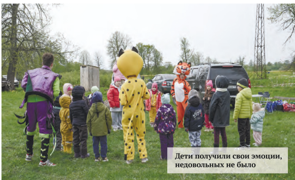
Дети получили свои эмоции, недовольных не было