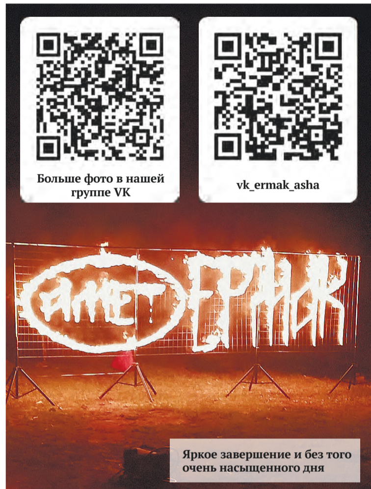
Яркое завершение и без того очень насыщенного дня

Екатерина Кипишинова, фото автора и предоставлено участниками