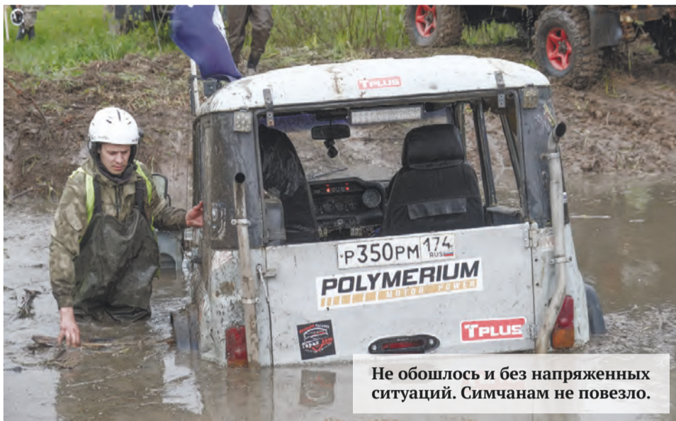
Не обошлось и без напряженных ситуаций. Симчанам не повезло.

В Аше задержали гаражных воров. В дежурную часть обратился 31-летний местный житель. Он рассказал, что у него из гаража пропал строительный инструмент на сумму около 20 тыс. руб. В ходе оперативно-розыскных мероприятий оперативники задержали подозреваемых в краже. Ими оказались безработные местные жители 26 и 33 лет. Ранее они уже привлекались к уголовной ответственности. В отношении подозреваемых возбуждено уголовное дело. Фигурантам избрана мера пресечения в виде подписки о невыезде и надлежащем поведении.