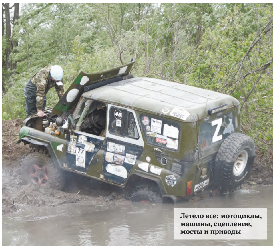
Летело все: мотоциклы, машины, сцепление, мосты и приводы