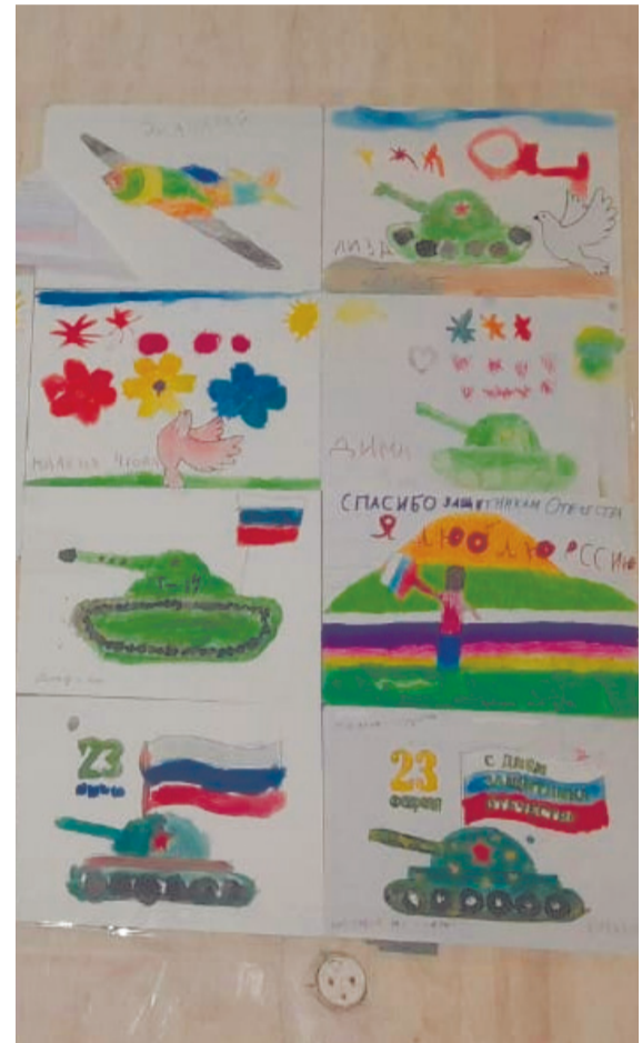
Рисунки детей Ашинского района украшают стены временного жилища солдат.

Конечно, это тяжелые моменты, когда вчера-позавчера ты с этими ребятами общался, а сегодня они уже «кразобразны». Только успел познакомиться, только успел подружиться... К этому нельзя привыкнуть. Думаешь о них, вспоминаешь их привычки и шутки, они долго еще снятся. Уверен, те, кто погибли на поле боя, все эти ребята – герои. И пока СВО не