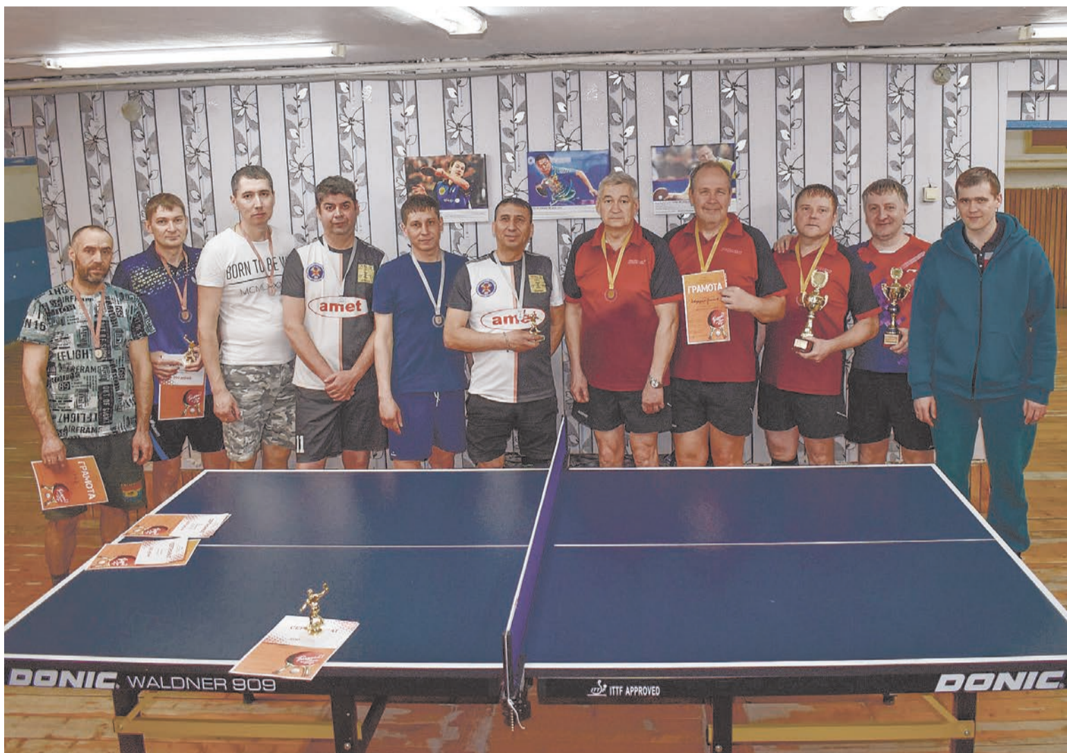
Впереди заводчан ожидает еще несколько соревнований по спортивным дисциплинам в рамках корпоративной Спартакиады 23-24 гг.

29 марта турниром по настольному теннису завершился очередной этап XXVI Спартакиады ПАО «Ашинский метзавод» сезона 2023-2024.