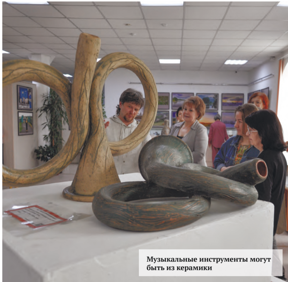
Музыкальные инструменты могут быть из керамики

Елена Тарасюк, фото автора и из открытых источников