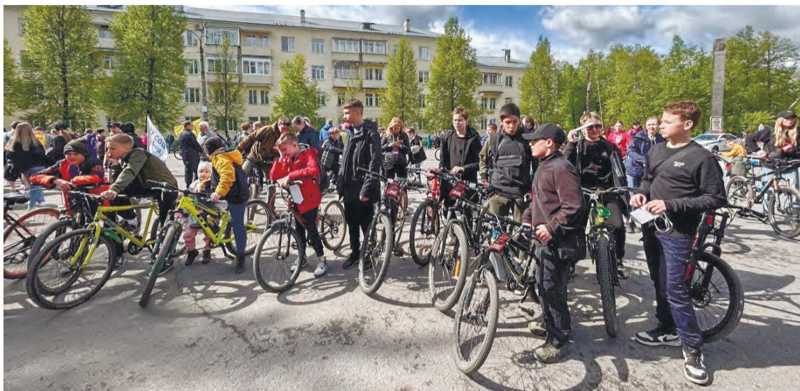
100 велосипедистов выехали на улицы Аши 1 мая.

Ашинский метзавод организовал масштабную производственную экскурсию для почти тысячи человек. А вот в центре Аши Первомай начали праздновать массовым велопробегом, который стал уже традиционным для этого праздника. Его организуют активные металлурги Союза рабочей молодежи. В велопробеге этого года участие приняли порядка ста человек, среди которых не только взрослые велосипедисты, но и дети самых разных возрастов. Регистрироваться и получать свои заветные