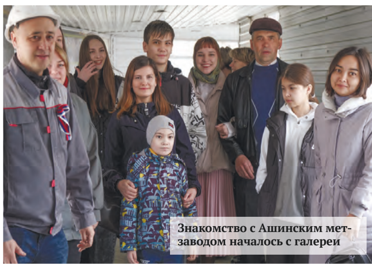
Знакомство с Ашинским метзаводом началось с галереи

Провели время замечательно, проехали по заводу на автобусе с ребятами, все детям показал, рассказал, замечательный маршрут. Планируем еще посетить центральную заводскую лабораторию. Все организовано на высоте, и экскурсовод хорошо, в доступной форме все объяснял. Машины подготовили, технику, было очень интересно. В прошлые годы мы уже были в ЭСПЦ № 2, в первом и втором прокатах, получается, что почти все площадки изучили. Но и дальше, если такие мероприятия будут продолжаться устраивать, сохраним привычку ходить на день открытых дверей доброй семейной традицией.