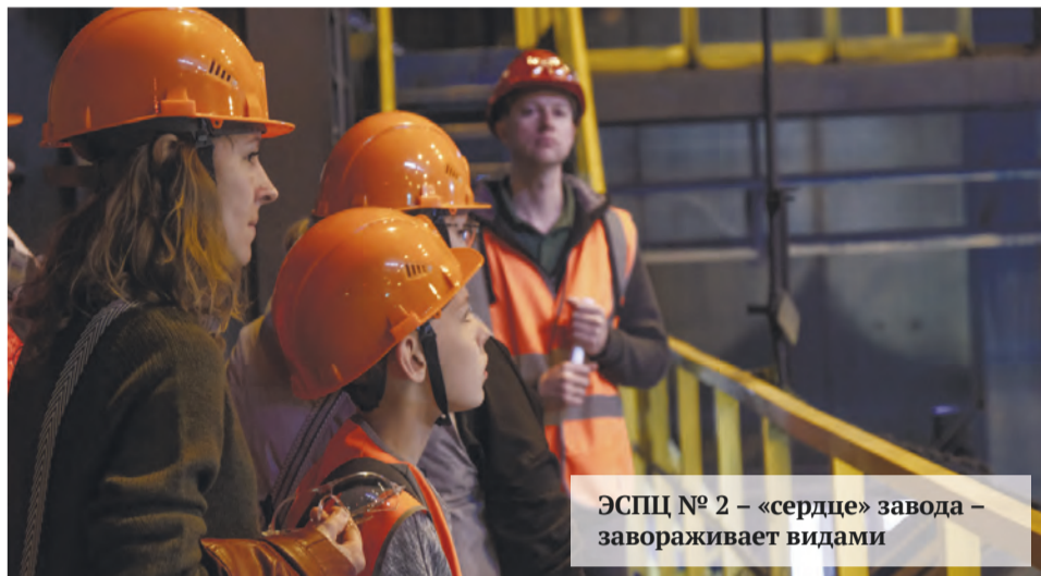
ЭСПЦ № 2 – «сердце» завода – завораживает видами