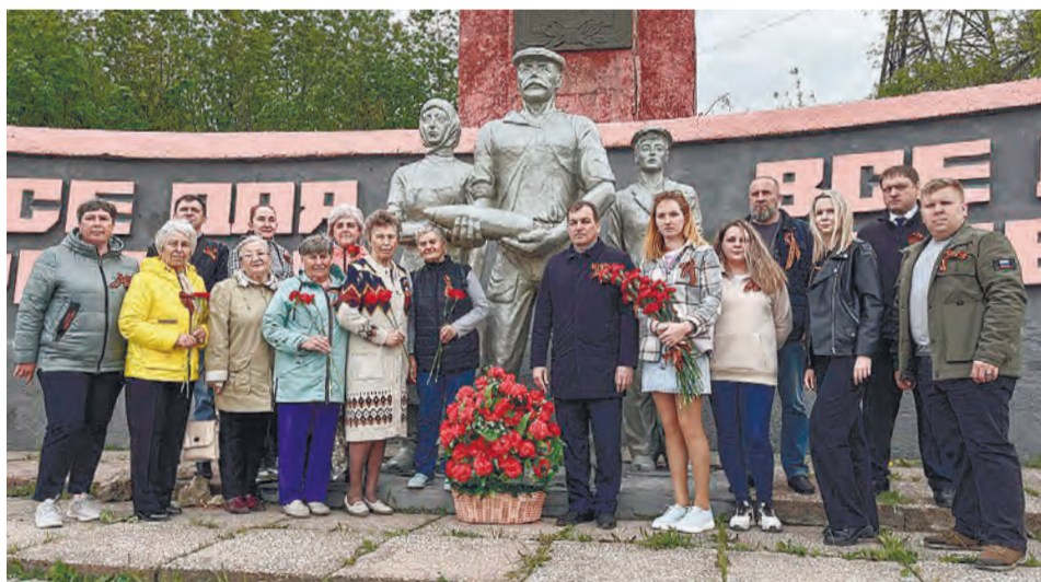
Помнить подвиг ветеранов – наш святой долг.

«Наконец, случилось это долгожданное событие и вечный огонь зажегся в поселке Лесохимиков у мемориала павшим в годы Великой Отечественной войны. Огромное спасибо компании «Газпром газораспределение Челябинск» за то, что делаете такое благое дело. От души поздравляю всех с 79-ой годовщиной Великой победы, будьте здоровы и счастливы, а самое главное – мирного нам всем неба!