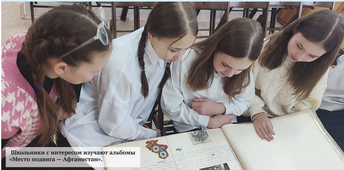
Школьники с интересом изучают альбомы «Место подвига – Афганистан».