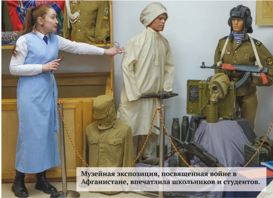
Музейная экспозиция, посвященная войне в Афганистане, впечатлила школьников и студентов.