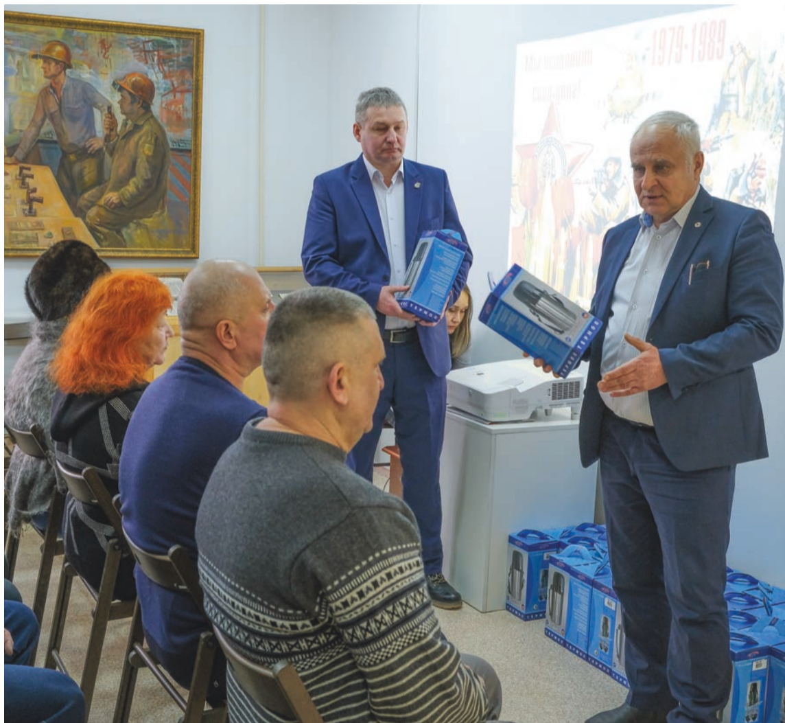
40 термосов АМЕТ с символикой праздника подарили ветеранам Афганской войны.