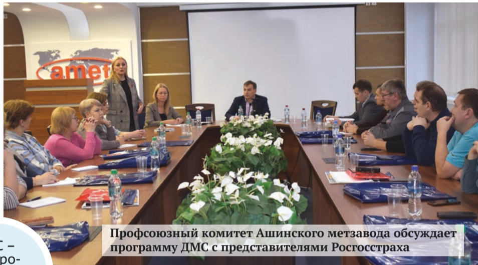
Профсоюзный комитет Ашинского метзавода обсуждает программу ДМС с представителями Росгосстраха